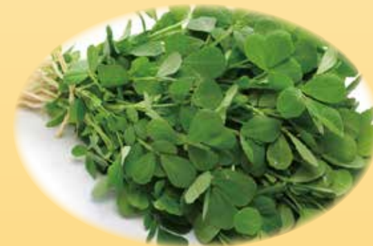
コロハ種子エキス 抗菌殺菌作用、免疫力向上