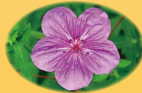
ホクベイフワロソウ油 鎮静保湿、抗炎症作用