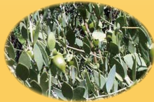
ホホバ種子油 フケ・かゆみ防止、浸透保湿作用