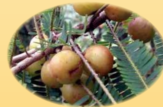
アンマロクエキス 「若返りの果実」と呼ばれる、美白保湿