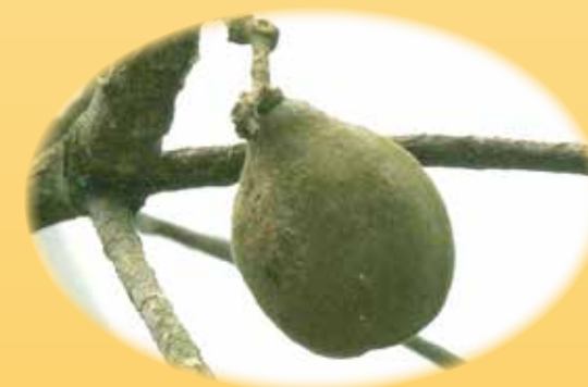
セイトカミロ balan 果実エキス 収れん効果、抗菌保湿作用