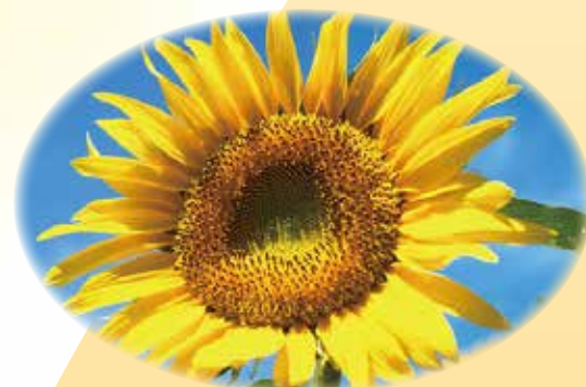
ヒマワリ種子油 毛髪保護、柔軟保湿、血行促進

※インドの伝統医学で、病気の予防や健康の維持増進、若返りを目的としていて、WHO(世界保健機構)も奨励しています。