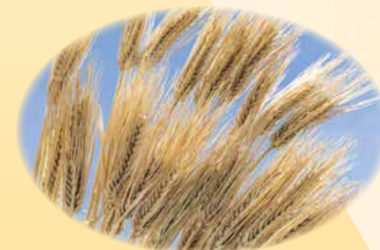
コムギ胚芽油 お肌にハリ・ツヤ、疲労回復