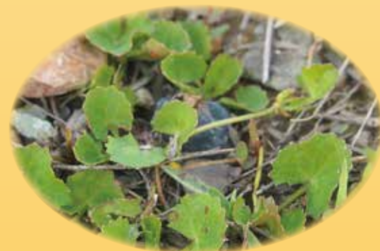
ツボクサエキス むくみ改善、コラーゲン生成促進