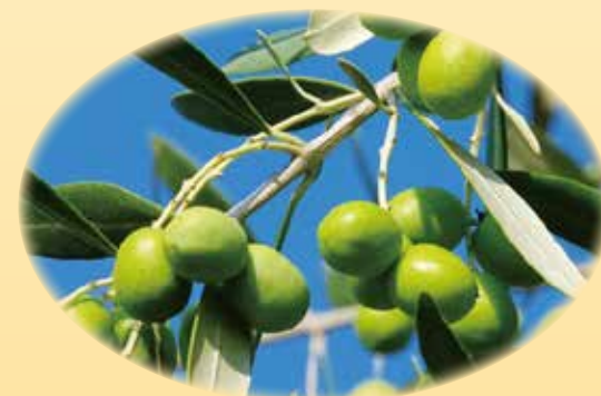
オリーブ殻油 白髪・抜け毛予防、抗酸化アンチエイジング