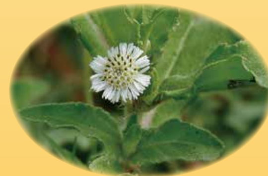
タカサブロウエキス 育毛養毛促進、抗菌消炎作用