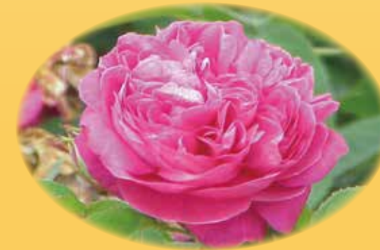
ローズ油 リラックス効果、ニオイ抑制