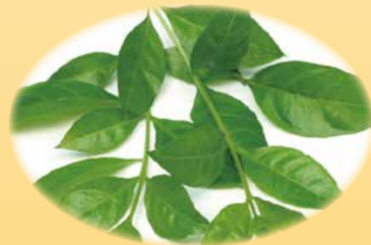
ヘンナ葉エキス トリートメント効果、頭皮改善